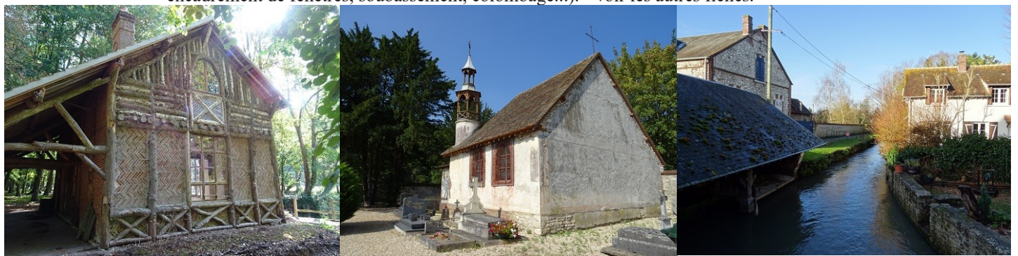
Les abords du monument

Les avis seront cohérents avec ceux émis ces dernières années, à savoir : pas de maisons à volume compliqué (type V, W, Y, ou Z), pentes à 45° pour les volumes principaux, ardoise ou tuile plate de teinte brun vieilli, à 20u/m 2 , avec un débord de toiture de 20cm, enduit de teinte beige clair avec modénatures (au choix : chaînages, encadrement de fenêtres, soubassement, colombage...). *Voir les autres fiches.